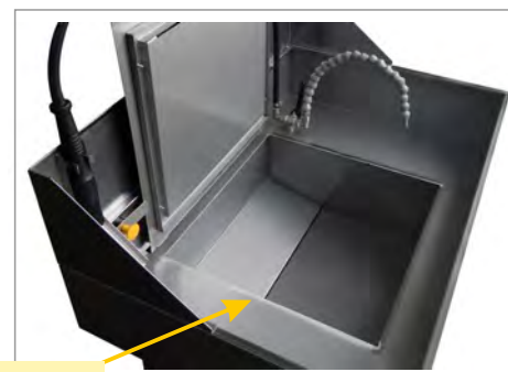
Alloggiamento per ammollo dei pezzi