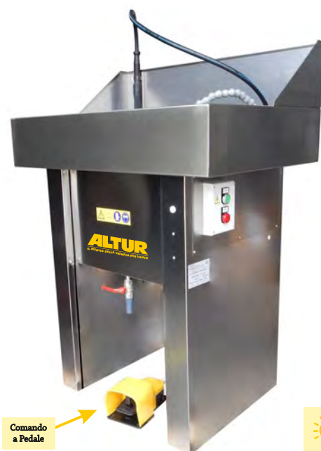
Comando a Pedale

Sempre pronta all'uso in quanto il sistema di alimentazione dei microrganismi mantiene sempre il liquido a temperatura operativa di 40-45°C